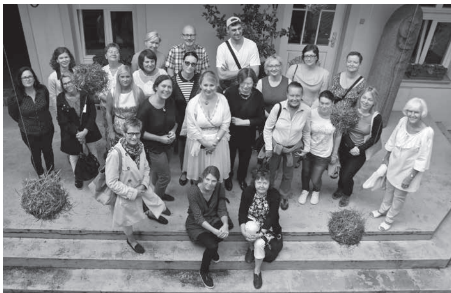
Koosolekul osalejad Slovakkia käsitöökeskuse ÚLUV hoovis