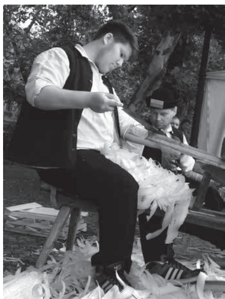
Meister Slovakkia käsitöölaadalt