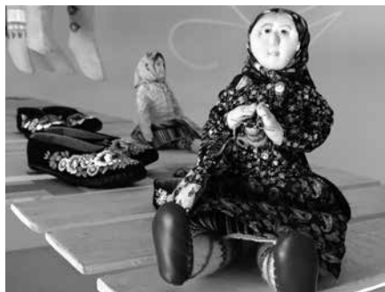
Kihnu tited, Muhu pätid, sukad Tõstamaalt, Muhust ja Kihnust

lastatakse suveteatrit ja galeriid. Aitäh kõigile, kes pikaks suveks oma tööd Dublinisse lubasid, aitäh kuraatoritele ja kujundajatele! 2016. aasta alguses ootab ees meie rahvakunsti tutvustav näitus Eesti suursaatkonnas Vilniuses, ettevalmistamisel on olulised näitused aastaks 2018.