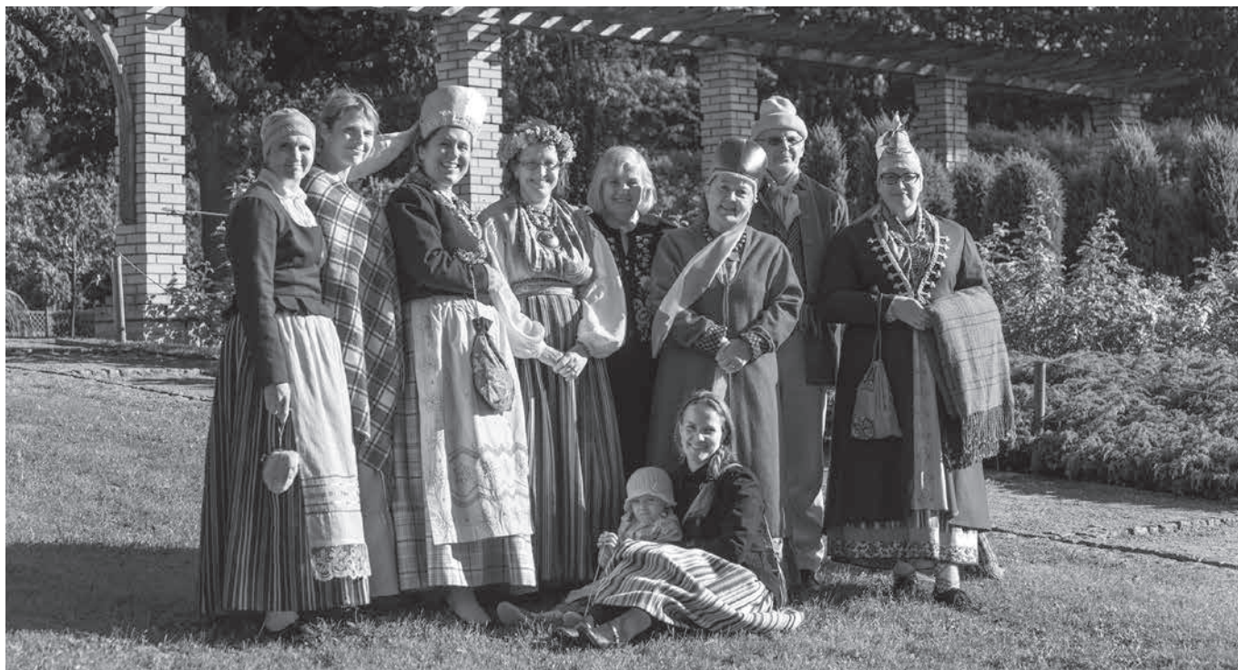
Esimene rahvarõivaste tuulutamine. Korraldustoimkond.

E elmisel Mardilaadal alanud teema-aasta Loomast loodud hakkab finišisse jõudma, et anda teed uuele teemale Rahvarõivas .