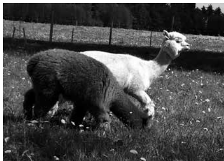
Wile Farmis Poaka külas toimus Käsitööpäevade ajal I Eesti alpaka festival