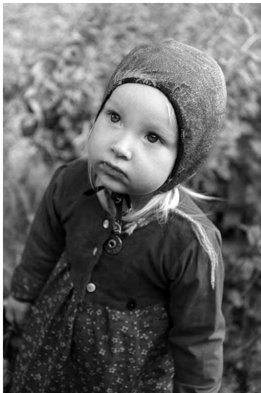
Lambamaost valmistatud müts konkursi Loomast loodud võidutööde näituselt. Autor: Kairi Orav.