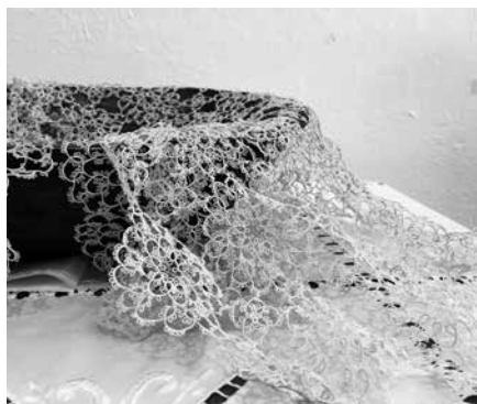
Kreeka pitsimeistri linik.

Tsakonia piirkonnas oli väga põnev näha kohalikkude meistrit püsttelgedel traditsioonilist vaipa kudumas. Tema õpetusel said ka meie vaibakudujad kätt proovida. Tsakonia piirkonna traditsiooniline kangakudumine sai alguse 19. sajandi