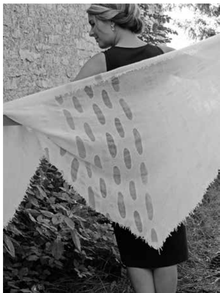
OÜ Vildiveski, reservtrükis rätik tooteperekonnast KOE

Vildiveski OÜ sai Tunnustatud Eesti Käsitöö märgise oma uuele tooteperekonnale KOE. Vildiveski ise on loodud 2007. aastal ja on meile rohkem tuntud FeltMilli nime all vilditud toodete valmistajana. Hetkel valmivad Tallinnas Kalamajas asuvas vildiateljees kahe meistri