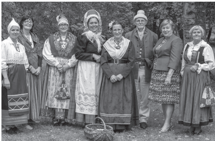
Rahvarõivaste tuulutamise meeskond Tallinnas 2016.

Suvel toimus 15. käsitöömeistrite suvekool Pärnus, aitäh Kristi Teder! Mardi-