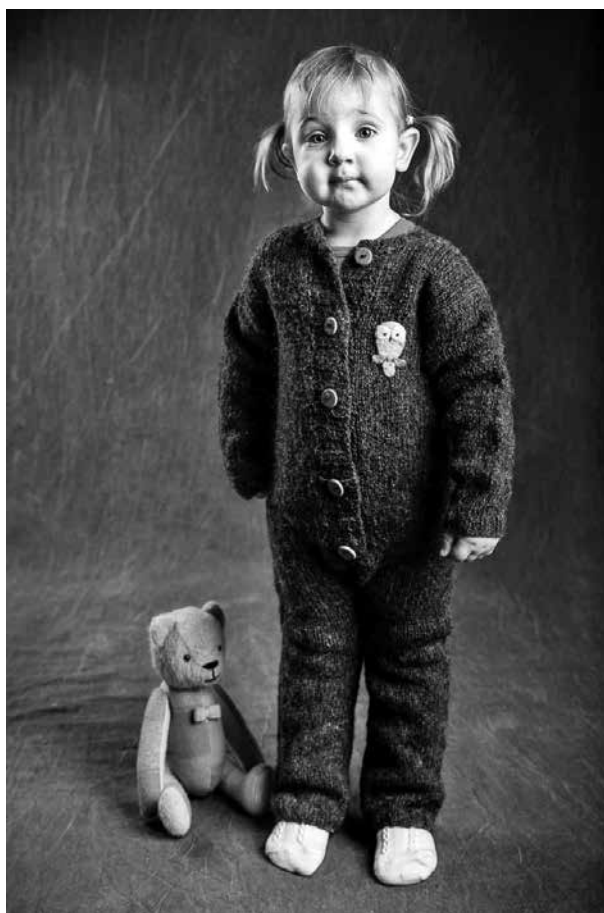
Villapai OÜ, sisekombinesoon Eesti maalambavillast.

Villapai OÜ toodab alates 2010. aastast kudumeid. Algmaterjaliks on Eesti vill ning kombineesone, veste, kleite, kampsuneid ja karupükse tehakse eelkõige väikelastele. Nüüd valmistatakse mõningaid tooteid ka täiskasvanutele. Kuna meie villavabrikutes ei ole garanteeritud vaid kohalikku päritolu tooraine, siis on Villapai võtnud suunaks teha otsekoostööd kohalike lambakasvatajatega, eelkõige Eesti maalamba karjade pidajatega.