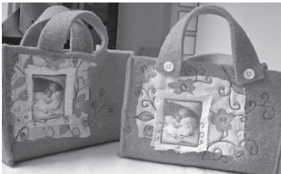
Pärnu suvekursusel valminud tööd.