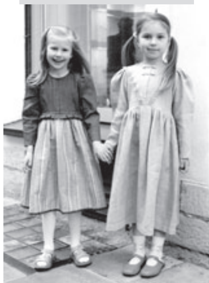
Rahvuslikel ainetel kleidid lastele. Autor Maaja Kalle.

videl täisvillasesest lõngast kootud pruutkleidile.