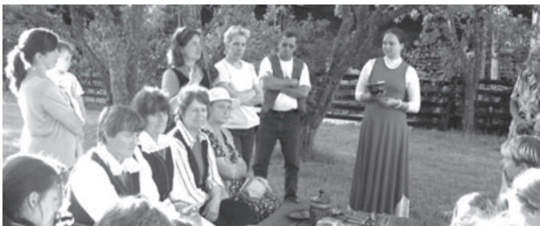
Soomra küla käsitööpäevadel.