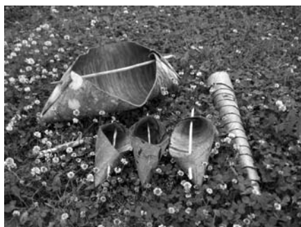
Projekti üks eesmärke on ununenud käsitöötehnikate taaselustamine. Teiste väljavalitute seas on ka tohutööd.

Iga tegevusala puhul püütakse leida uusi lähenemisviise mõlema maa kogemusi kasutades. Projekt pakub ka huvilistele rohkelt