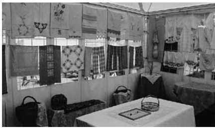
Endisaegsed ja uued köögitekiitid näitusel "Eesti köök läbi mitme sajandi".

Et saada ettekujutust, milline on olnud eesti köök aegade jooksul, otsiti välja ja korjati ümbruskonnast kokku kõikvõimalikke vanaaegseid köögitarbeid. Näitusel olid vanad kohviveskid, petrooleumilambid, puukulbid ja -lusikad, suhkrutoosid, savikausid, vitsi-