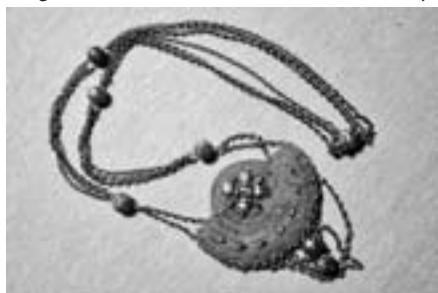
Mulgi tanumaal.

Ühe sellise ettevõtmise tulemusel sündis ka 2011. aasta mardilaadaks toode - Mulgi tanumaali ainele kaelehe. Perfektne teosus ja loov lähenemine iseloomustavad kõiki Virge töid. Oma käsitööalaseid teadmisi ja