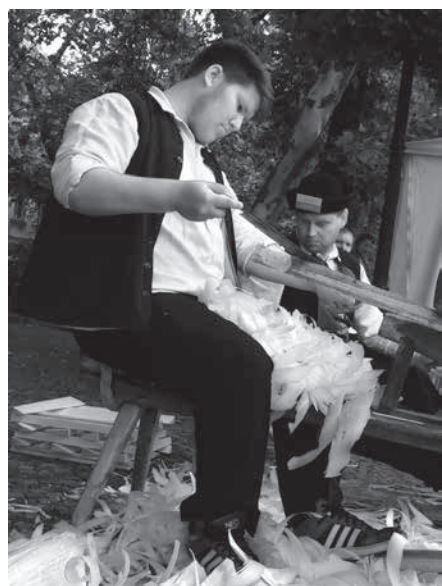
Meister Slovakkia käsitöölaadalt