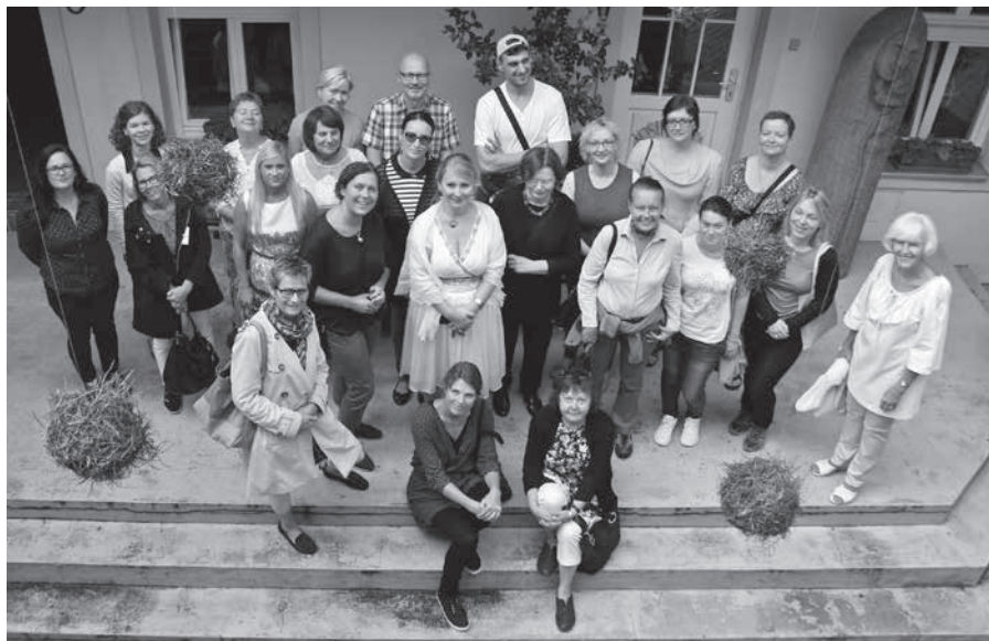
Koosolekul osalejad Slovakkia käsitöökeskuse ÚLUV hoovis