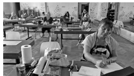
Pärnu suvekool 2016

Kursuse sissejuhatuses, kui õpetaja selgitas, mida me teha ei tohi, tekkis üldine põnev segadus. Mida siis teha tohib!? Seda hakkasimegi otsima. Mõned näited kompositsiooniülesannetest: pidurdab ja pöörab tagasi; tõmbab hinge ja sukeldub; läheb kakkuseks; kogub kokku, jaotab laiali; kogub kokku, pillab laiali; kogub kokku, puhub laiali. Inspiratsiooni otsisime rooma numbritega kirjutatud kuupäevast, üraskite poolt näritud puukoorest, päevauudistest, Pärnu jõest ja millest kõigest muust. Nagu