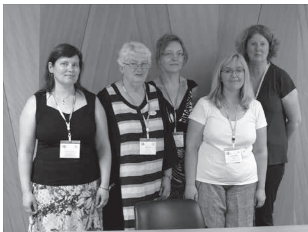
OIDFA kongress 2016.

Kuigi eestlased osalesid loengutes ja vaatasid pitse, käisid linnas näitustel ja ekskursioonidel, siis kõige olulisem oli lepingu allkirjastamine. Rahvusvahelise Niipis- ja Nõelpitsi Organisatsiooni (OIDFA) ja Eesti niplajate esindajad all-