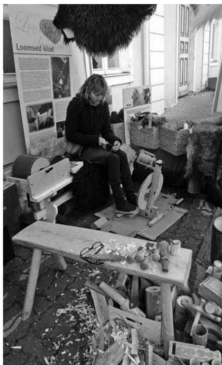
XXI Käsitööpäevad Rakveres. Pärnumaa töötuba Pikal Kreisilaadal.

1996. aasta juuni algul toimusid esimesed üle-eestilised käsitööpäevad Rakveres. Tookord ei julgenud loota, et alguse saab nii pikaajaline ja tugev traditsioon. Kahekümne aasta jooksul on käsitööpäevi korraldatud igakevadise sündmusena, et tutvustada lähemalt erinevate piirkondade kultuuri ja käsitööd. Täna on Eestile ring peale tehtud ning juubelit tähistavad käsitööpäevad toimusid taas Rakveres 10.–11. juunil, et alustada uut ringi.