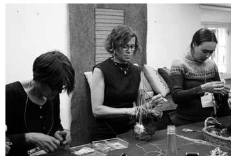
CraftCamp 2016.