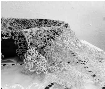
Kreeka pitsimeistri linik.

Tsakonia piirkonnas oli väga põnev näha kohalikku meistrit püsttelgedel traditsioonilist vaipa kudumas. Tema õpetusel said ka meie vaibakudujad kätt proovida. Tsakonia piirkonna traditsiooniline kangakudumine sai alguse 19. sajandi