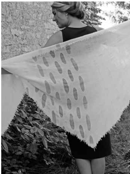
OÜ Vildiveski, reservtrükis rätik tooteperekonnast KOE

Meistrimärgise sai Villapai OÜ oma Eesti maalamba- ja alpakavillast toodetele.