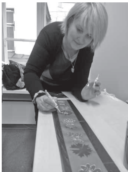
Käsitöökojad Üle Maa Tallinnas Allikamaja koolituskeskuses, pärjalintide ja oubide valmistamine.

Infot käsitöökodade kohta sai leida nii Facebookist Käsitöökojad Üle Maa