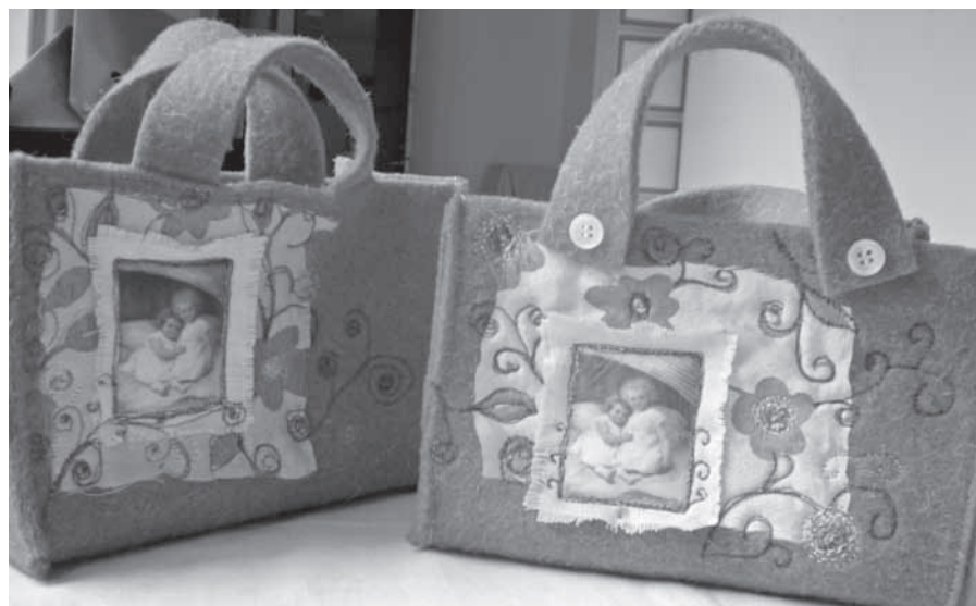
Pärnu suvekursusel valminud tööd.