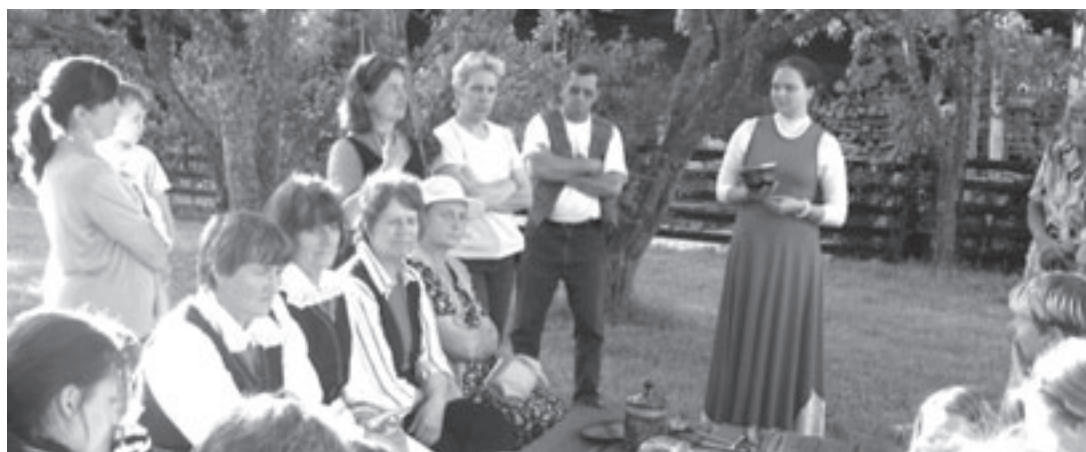
Soomra küla käsitööpäevadel.