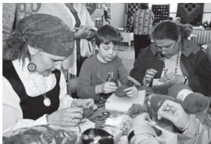
Nöelvidi õpikoda Raplamaa käsitööpäevadel