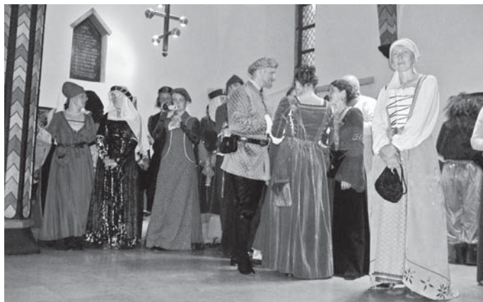
Linnakodanikud raekojas karnevalil

Suurte kiidusõnadega pärjaks narre, kes rahvast lõbustasid. Head hääled ja lahedad naljad.