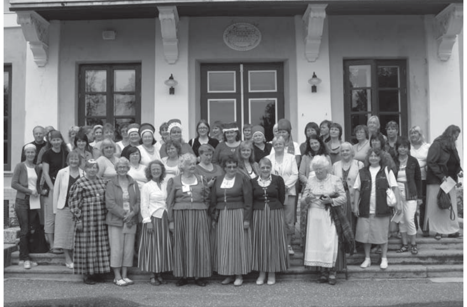
Rahvarõiva laager Tõstamaal