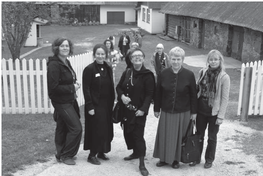
Kangakudumise konverentsist rõõmu tundvad käsitööliidu eestvedajad

Teise päeva hommikul oli võimalus külastada jüripäeva jumalateenistust, mis oli pühendatud Värksa kiriku 250. aastapäevale. Konverentsi lõpetas ringkäik Seto Talumuuseumis ning traditsiooniline seto toit Tsäimajas.