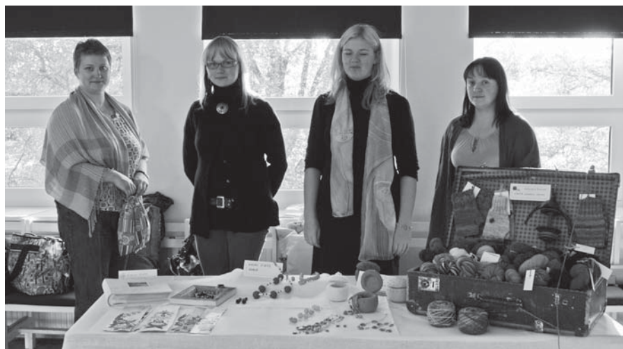
Käsitööga tööle II Rakvere rühm esitles oma tooteid ettevõtlusfoorumil