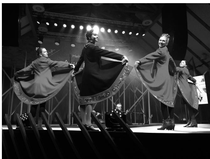
Rahvuslikud rõivad etenduselt OmaMood.

Tartu Ülikooli Viljandi kultuuriakadeemia kuulub ülikooli humanitaarteaduste ja kunstide valdkonda ning kultuurialast haridust on siin antud juba 65 aastat. Tunnustatud õppejõudude ja loomeinimeste käe all saab õppida etenduskunstide, kultuurhariduse, muusika ja rahvusliku käsitööga seotud õpesuundadel. Meie tunnuslause