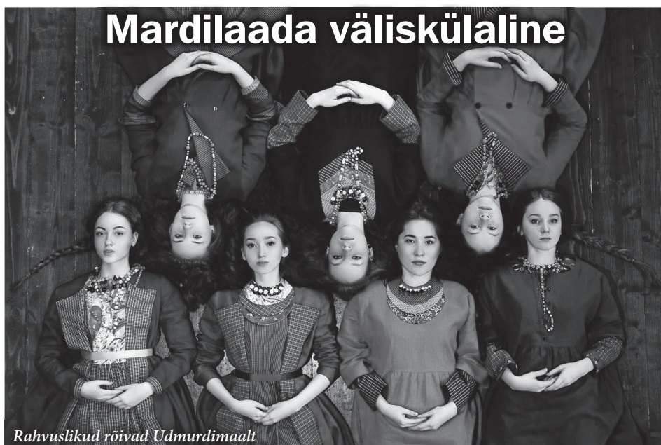
Rahvuslikud rõivad Udmurdimaalt

Korraldajal on õigus teha muudatusi programmis nii esinejate kui kellaaegade osas