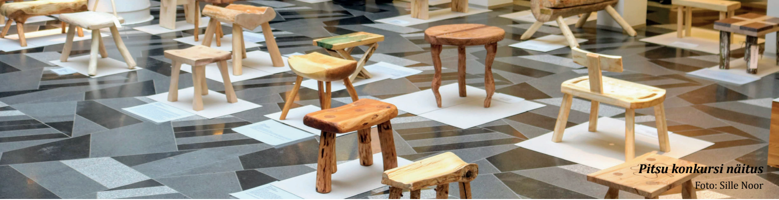
Pitsu konkursi näitus