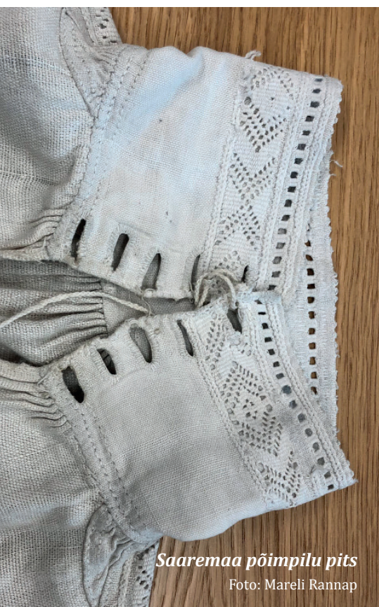
Saaremaa põimpilu pits

Pitsipilte ja mustrijooniseid koos (aja)looga võib saata e-maili aadressil liis@folkart.ee.