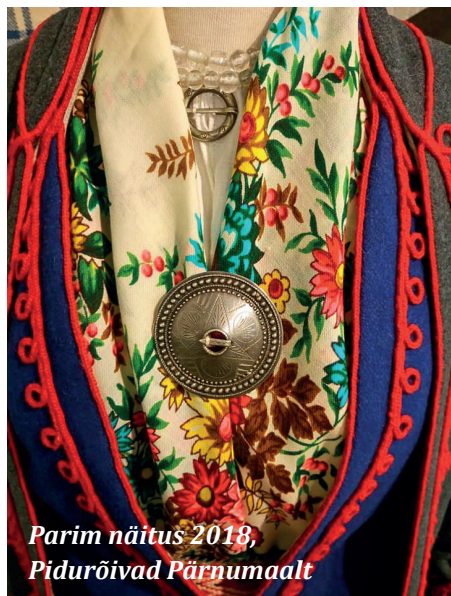
Parim näitus 2018, Piduriided Pärnumaalt