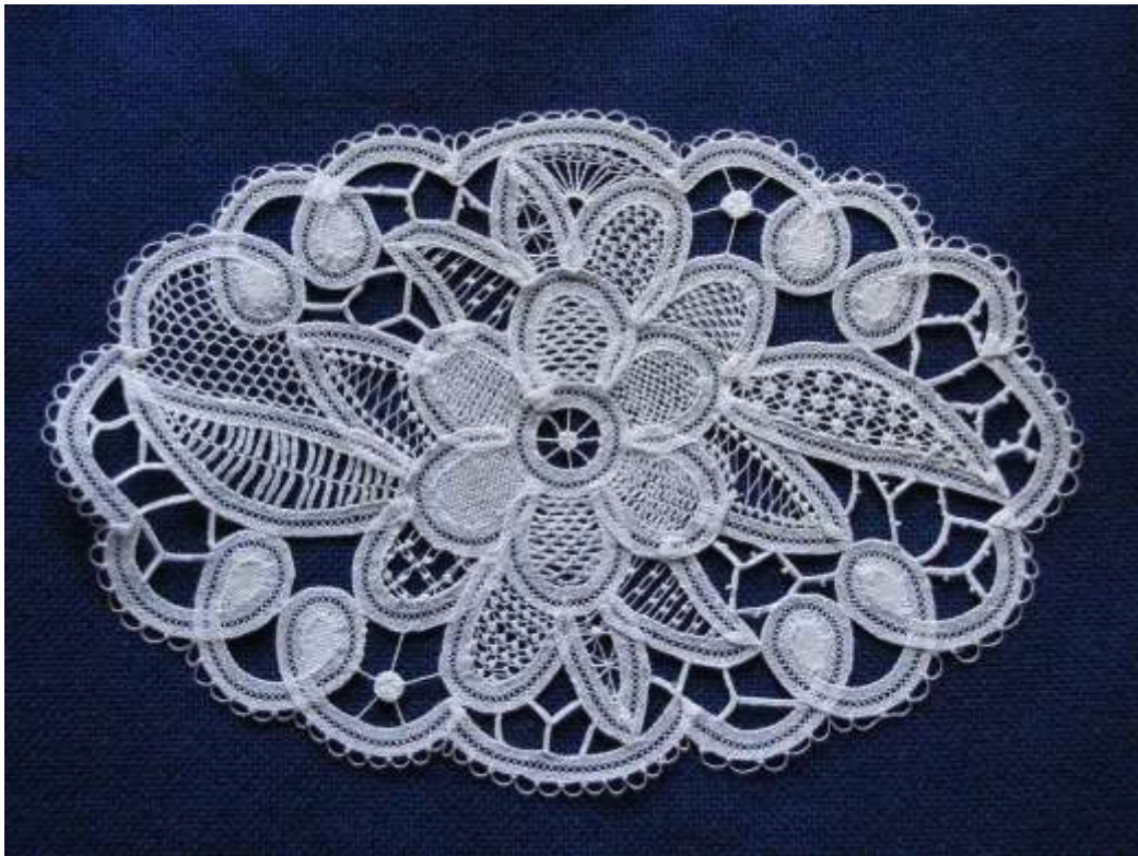
Luxeuil' i nõelipits