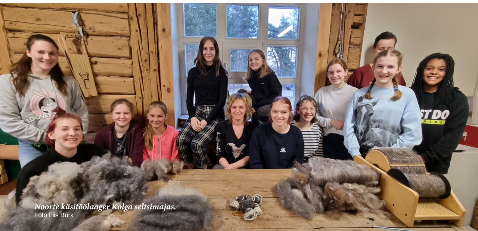
Noorte käsitöölaager Kolga seltsimajas.