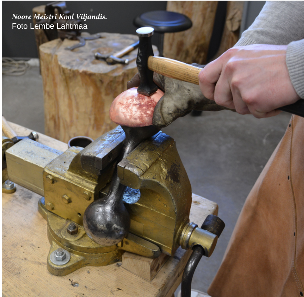
Noore Meistri Kool Viljandis.