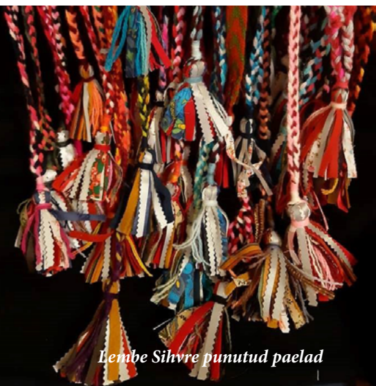
Lembe Sihvre punutud paelad

enda leiutatud töövahendil MultiWeave. Laager toimus Harjumaal Kolga seltsimajas ja Lahemaa pärimuskojas. Uus laager toimub septembrikuus Viljandis. Eraldi suur eesmärk aastateema raames on luua käsitööliidule noortekogu, milleks sai esimene samm astunud juba 2021. aasta oktoobris. 15. mail toimus Tallinnas koostöökoogu, kus panime koos noortega pead kokku ja kirjutasime üles hulga mõtteid, mida soovitakse koos teha. Ideid tuli arvukalt ja nii tore oli tunda, kuidas noored koos tegutsedes soovivad käsitöömaailma tulevikku muuta. Rõõmuga saame pärast koostöökoogu hõisata, et käsitööliidu juures on nüüd toimetama hakanud ka noortekogu!