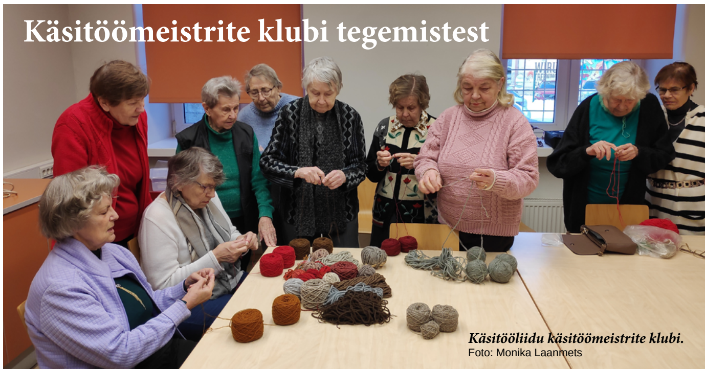
Käsitööliidu käsitöömeistrite klubi.