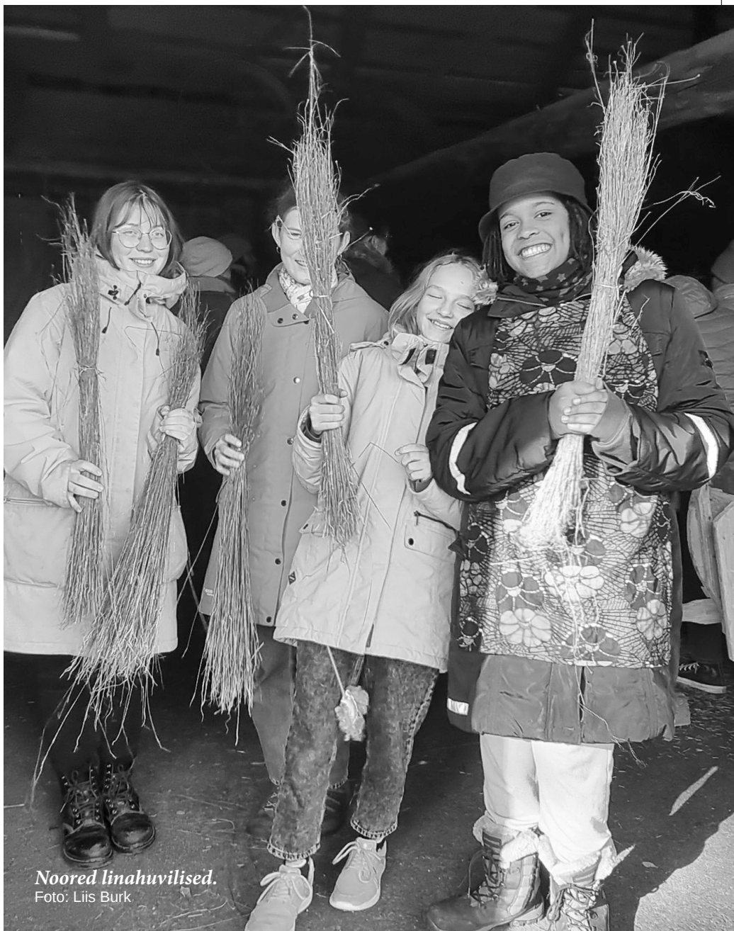
Noored linahuvilised.