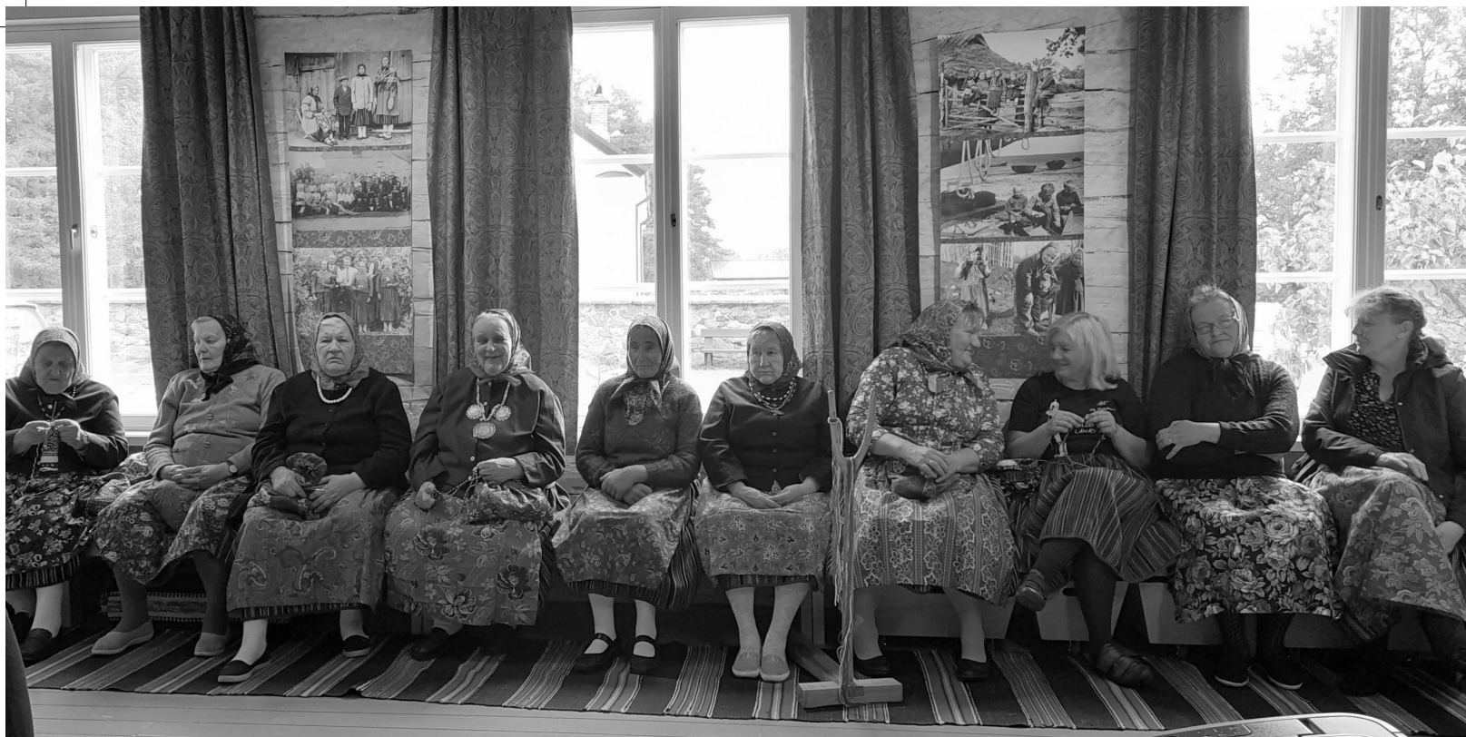
Huvi ettevõtluspäeva vastu oli kihnlaste seas suur.