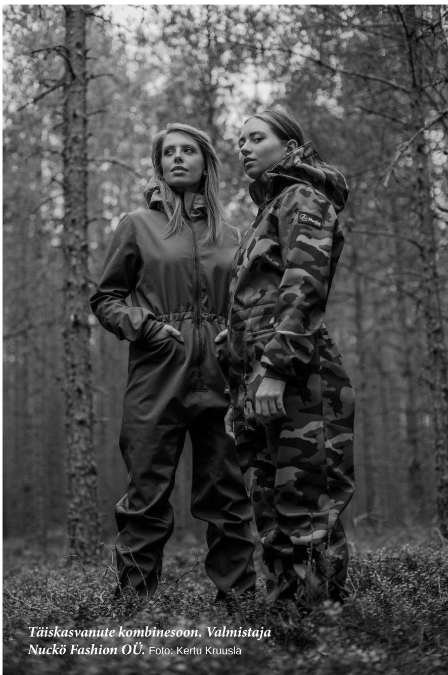
Täiskasvanute kombinesoon. Valmistaja Nuckö Fashion OÜ.

Kõiki võitjaid esitletakse Mardilaada esimesel päeval, 3. novembril. Kogu laada jooksul on need tooted tähistatud märgisega Uus Toode Mardilaadal.