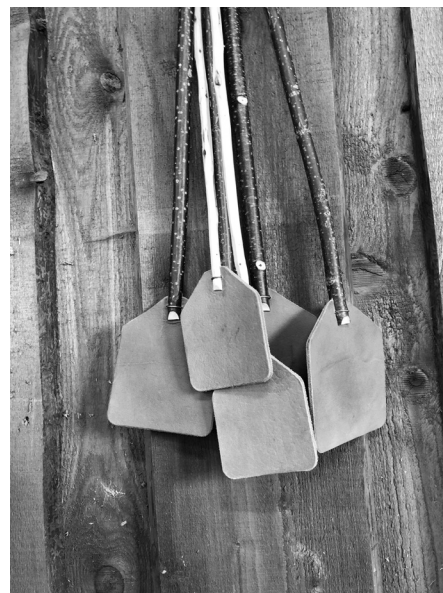
Kärbsepiits „Eluaegne“. Valmistaja Lahemaa Pärimuskoda.