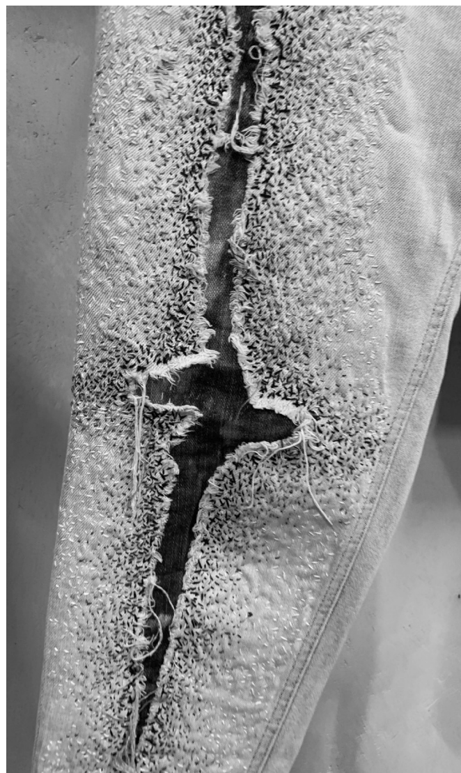
Konkursil osalenud töö.