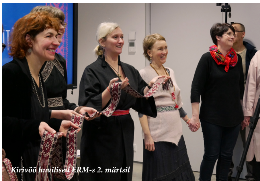
Kirivöö huvilised ERM-s 2. märtsil