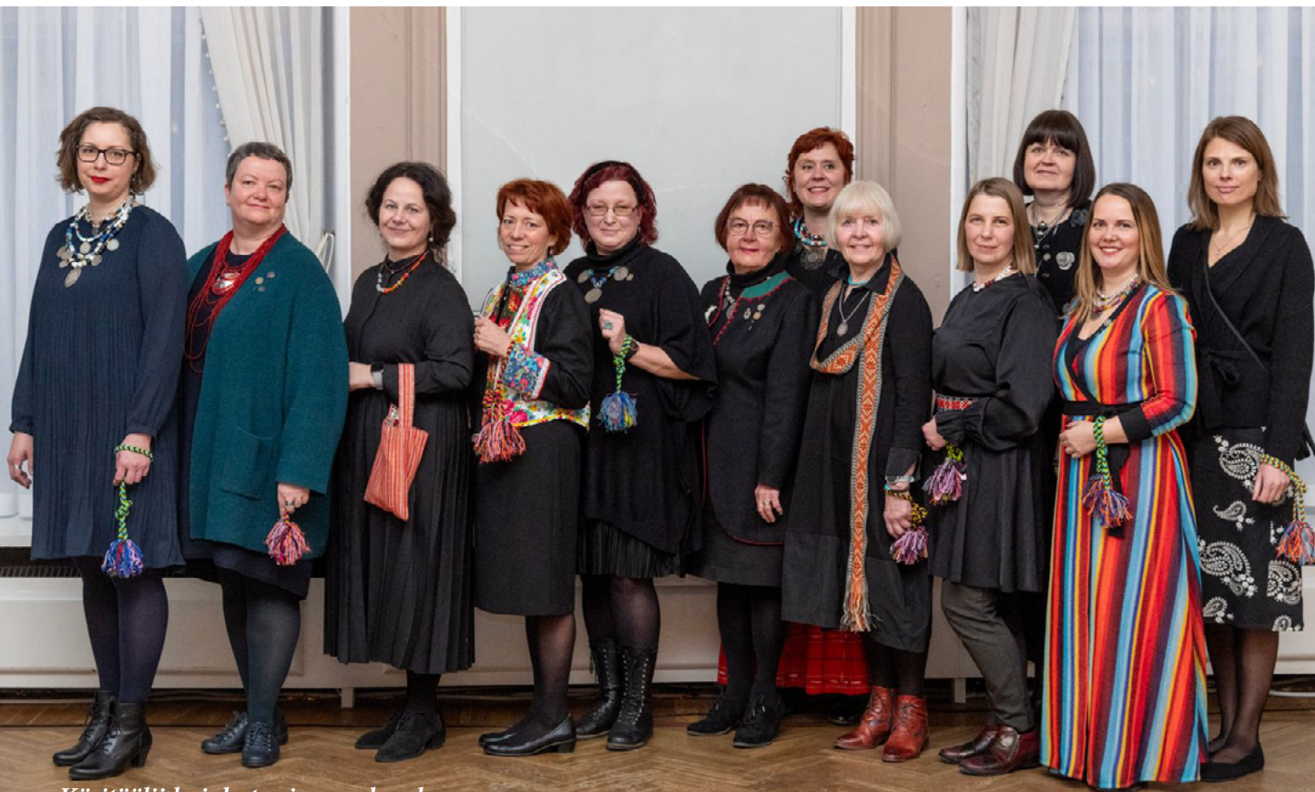
Käsitööliidu juhatuse ja meeskond.

Aasta paikkonnategu 2023 oli Eesti Kultuuriseltsi Chicagos rahvarõivakooli organiseerimine ja suvise rahvarõivaste tuulutamise algatamine eest Põhja-Ameerikas.