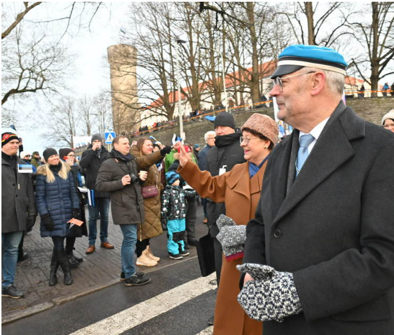
Lipu heiskamisel 24.02.2024 Toompeal, Kannaneestikindaid